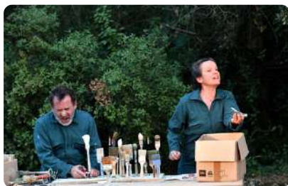
« les arbres modestes » de la compagnie VOLPINEX