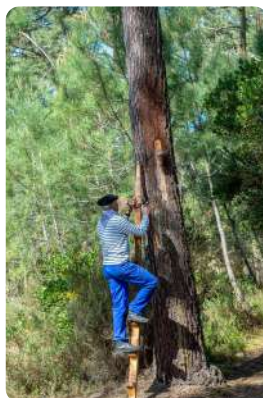
Les gascons de Biscarosse, Gemmeurs des Landes

Tous les spectacles et animations sont gratuits (sauf le film projeté à l'Atrium le 17 mai au soir)