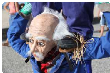
Création du collectif KoMoNo