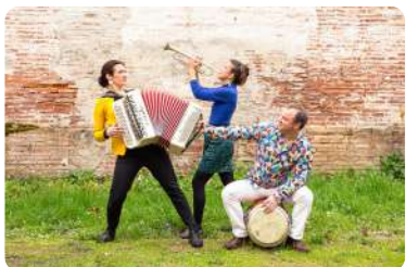
Le groupe Pipit Farlouse