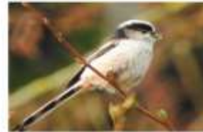
Mésange à longue queue