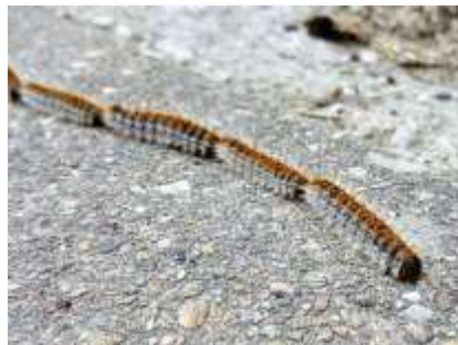
La « procession » des chenilles